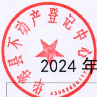
2024 年度部门整体支出绩效自评表